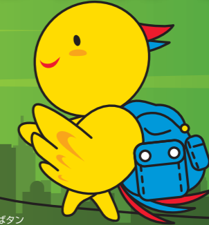
防災マスコットはぼたん

阪神・淡路大震災から復興した街並みを巡り、 防災意識を新たにしながら歩いてみませんか。